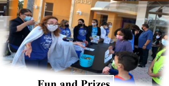
Fun and Prizes