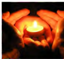
Light a Candle Enciende una vela

Aug. 5 FIRST FRIDAY OF FIRE Aug. 5 PRIMER VIERNES DE FUEGO