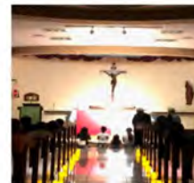
Say a prayer Haz una oración